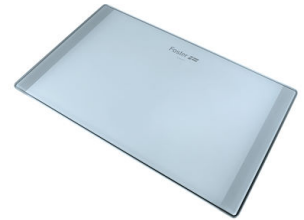
Tagliere in cristallo 8633 300